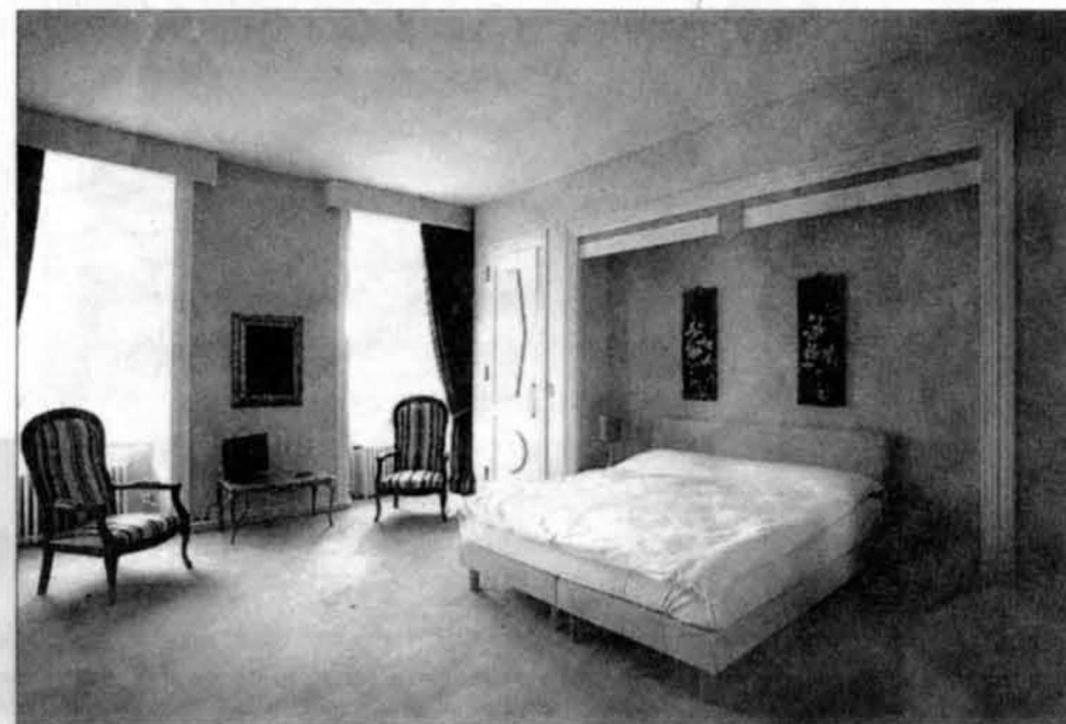
Les chambres au décor individualisé ont une vue imprenable sur le lac en contrebas