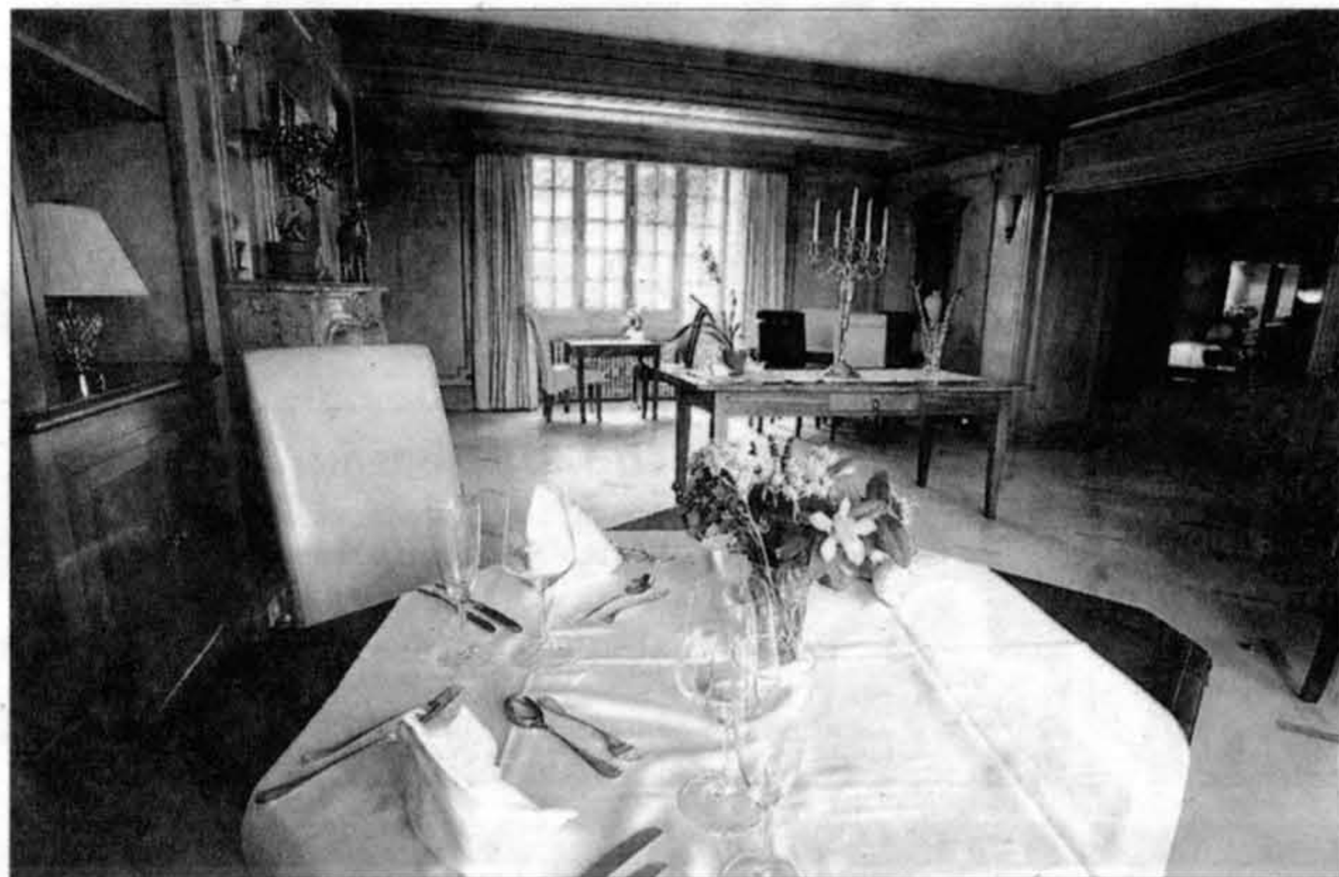
La salle de restaurant joue la sobriété des matériaux nobles